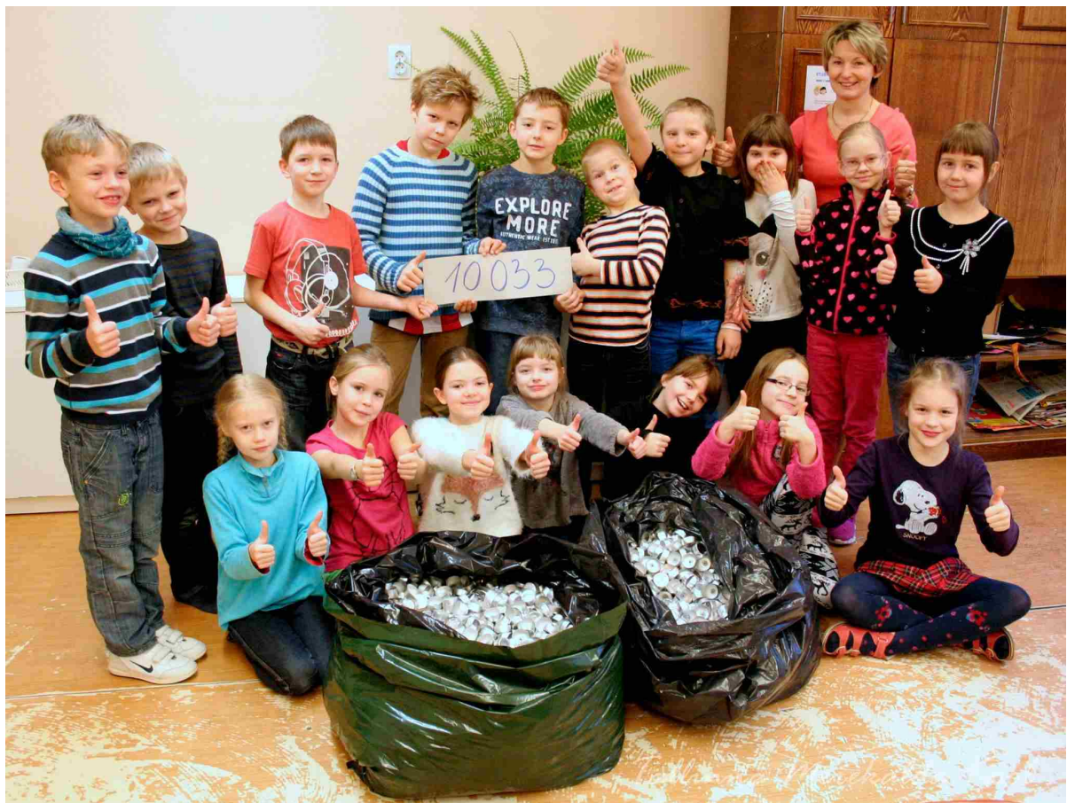
Tallinna Merkalda Kool