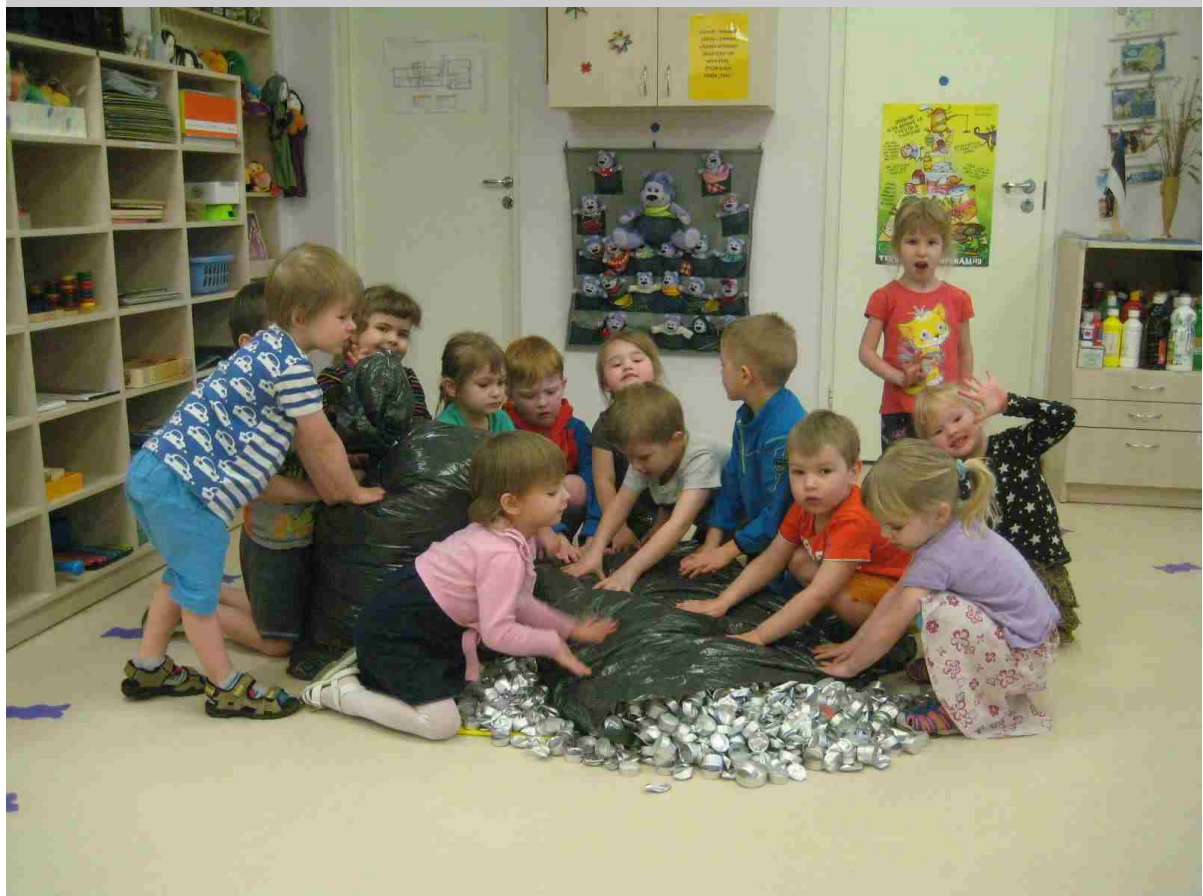
Viiratsi Lasteaed, rühm Mikud-Mannid